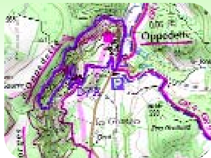
Carte IGN 3242 OT Extrait carte IGN SCAN 25 ® - © IGN 2014 Copie et reproduction Interdite

L'éditeur, l'auteur ou le diffuseur ne sauraient être tenus pour responsable dans l'hypothèse d'un accident sur cet itinéraire, et ce, quelles qu'en soient la cause. Pour les secours composer le 112.