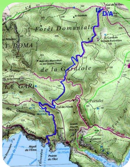
Carte IGN Les Calanques 1:15 000 Extrait © IGN 2014 Copie et reproduction Interdite

La calanque de l'Esseidon ainsi que son aiguille surgissent de l'épaisse végétation méditerranéenne. Une lucarne dans la roche laisse entrevoir le bleu azur de la mer.