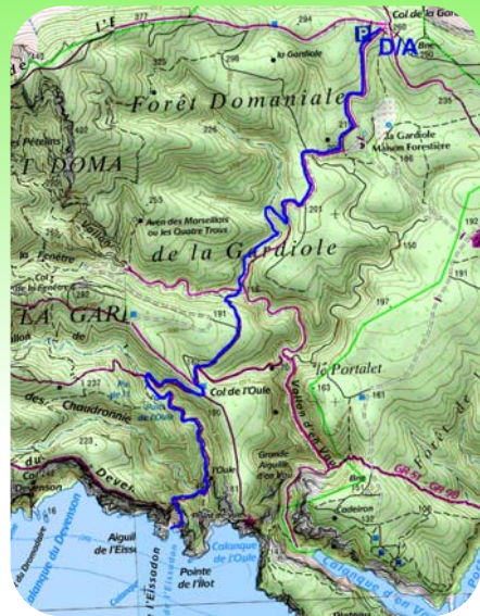
Carte IGN Les Calanques 1:15 000

C'est ici que commence la partie technique de l'itinéraire. Prendre un petit chemin à gauche qui mène en descendant vers les départs des voies d'escalade. Se diriger vers la droite en se faufile à travers les chênes Kermes. Un petit couloir nécessite de poser les mains et invite à la prudence. Une corde peut être utile pour les moins expérimentés. L'accès à l'eau se fait sur la partie droite de la calanque. La faille de l'Esissadon se situe à 20 mètres.