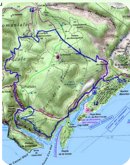
Carte IGN Extrait carte IGN SCAN 25 3245 ET

Pour le retour, remonter le vallon d'En Vau en suivant l'itinéraire 7 jusqu'à la maison forestière de la Gardiole. Là, emprunter l'itinéraire 7A à droite pour une courte descente. Dans le deuxième virage, prendre à gauche l'itinéraire 5. En suivant les balise marron, il vous amènera par le plateau des Mussuguières et le pas des Marmots jusqu'à la calanque de Port Miou avec une vue splendide en fin d'après-midi sur les falaises de Soubeyrannes. Il ne reste plus qu'à remonter l'avenue des Calanques pour rejoindre votre véhicule.