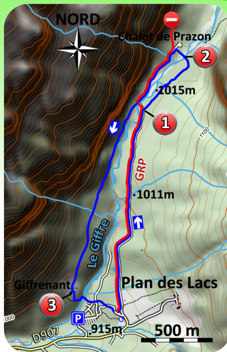
Carte IGN – 3530 ET