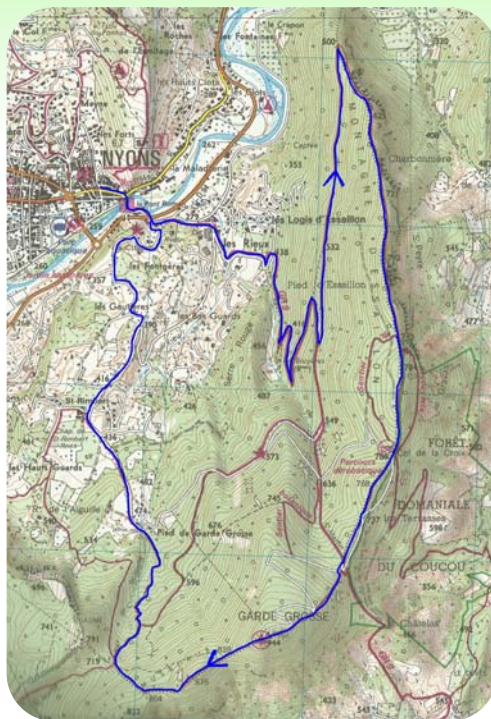
Carte IGN 3139 OT

Un énorme cairn signale le début de la montée de la montagne d'Essaillon avec de belles vues la montagne d'Angèle ou de Lance puis sur le Ventoux. Au niveau du sentier d'interprétation, poursuivre dans la forêt en face. Une fois la route atteinte, traverser là et filer en face. Au niveau de la balise «le double lacet» (755m), prendre la direction de Garde Grosse. Ce sommet, point culminant de la randonnée avec ses 944 mètres, offre une vue spectaculaire. Entamer la descente par la croupe ouest. A l'intersection, continuer tout droit en suivant les marques jaunes. Plus bas, continuer la descente en empruntant le sentier de gauche qui rejoint la route. Progresser sur celle-ci par la gauche. A la balise St Rimbart, poursuivre tout droit (plus de marque). Dans l'épingle à cheveux, tourner à gauche puis à droite. Plus que quinze minutes avant de rejoindre Nyons.