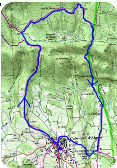
Carte IGN 3143 OT Extrait carte IGN SCAN 25 ® - © IGN 2018 Copie et reproduction Interdite

Après le petit col , continuer tout droit au premier carrefour (1h). Le GR97 rejoint le GR92 par la gauche. Puis après 100 mètres quitter les GR et prendre la deuxième piste à droite au panneau. Au croisement suivant, continuer tout droit sur la piste principale. Passer devant le jas de Pécou (1h15) jusqu'à la citerne (balise jaune). Quitter la piste et prendre le chemin à droite (1h30). Au bas de la descente, tourner à droite (1h35) lorsque vous apercevez les balises jaunes. La piste devient route et au panneau "les Vaucèdes" prendre à droite (2h10). 100 mètres plus loin, bifurquer sur le petit chemin à gauche.