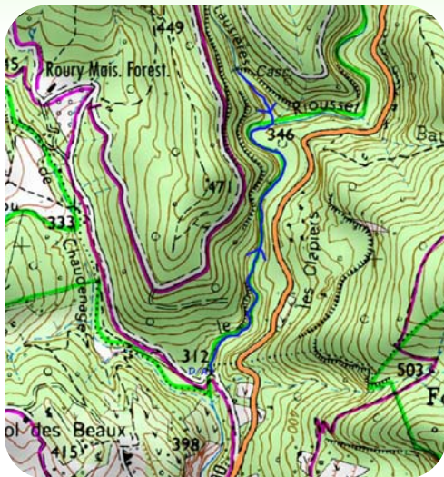
Carte IGN 3137 OT - © IGN 2018

! Ne pas s'aventurer sur cet itinéraire après de fortes pluies ou pendant des épisodes orageux.