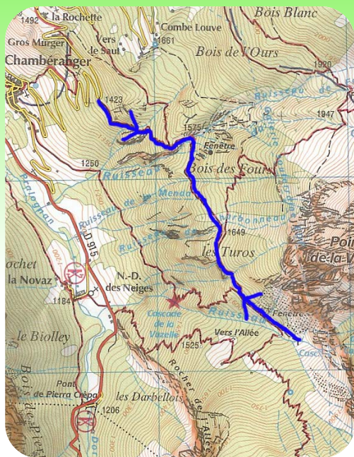
Carte IGN 3534 OT Extrait carte IGN SCAN 25 ® - © IGN 2018 Copie et reproduction Interdite

Laissez votre véhicule dans l'épingle à cheveux