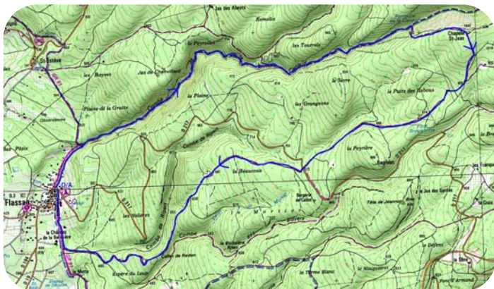
Carte IGN - 3140 ET

Parking possible dans le village de Flassan