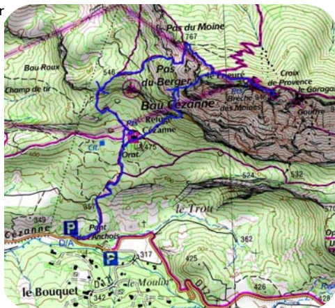
Carte IGN Extrait carte IGN SCAN 25 3244 ET © - © IGN 2018 Copie et reproduction Interdite

Pour le retour , redescendre un temps par le GR9 sur quelques mètres puis par le sentier Imoucha en suivant l'itinéraire bleu en direction de Bimont. 50 mètres après un muret prendre plein sud, à gauche vers l'itinéraire rouge par le pas du Berger. Là aussi, les personnes moins à l'aise avec ce type de terrain poursuivront encore un peu jusqu'au pas de l'Escalette plus facile à la descente (point rouge). Les autres affronteront cette descente technique et spectaculaire pour rejoindre le refuge Cézanne, puis en quelques minutes seulement le parking de l'Anchois.