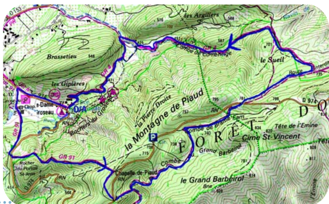
Carte IGN 3140 ET Extrait carte IGN SCAN 25® - © IGN 2018 Copie et reproduction Interdite

RISQUE INCENDIE: Les accès aux massifs du Vaucluse sont soumis à réglementation en période estivale.