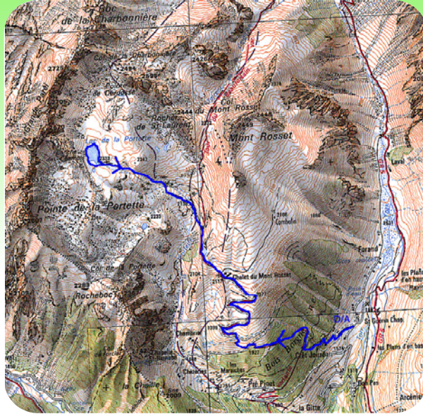
Carte IGN 3532 OT Extrait carte IGN SCAN 25 ® - © IGN 2018 Copie et reproduction Interdite

Départ depuis le parking de Saint Guérin Chap