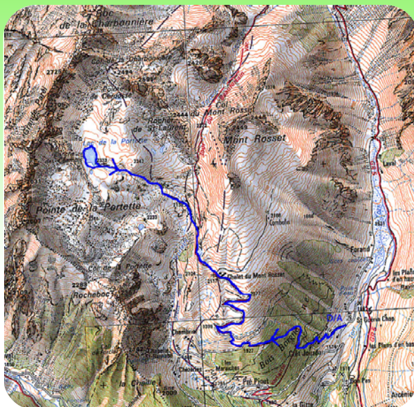
Carte IGN 3532 OT Extrait carte IGN SCAN 25 ® - © IGN 2018 Copie et reproduction Interdite

L'éditeur, l'auteur ou le diffuseur ne sauraient être tenus pour responsable dans l'hypothèse d'un accident sur cet itinéraire, et ce, quelles qu'en soient les causes. Pour les secours composer le 112.