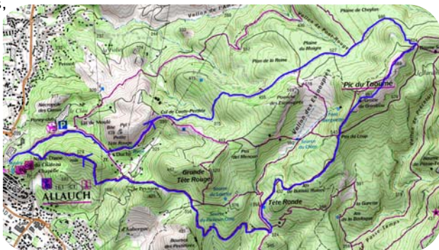
Carte IGN 3245 ET Extrait carte IGN SCAN 25 ® - © IGN 2018 Copie et reproduction Interdite

Peu après la source prendre le chemin à droite qui remonte sous les falaises. Par la suite couper ce qui ressemble à une piste et continuer tout droit 100 mètres plus loin (4h). Après une courte descente dans un épais sous-bois, ignorer le chemin à droite. Plus loin le sentier grimpe sur la colline avant de passer devant d'anciennes ruines. Au niveau du col sous le château, prendre la sente à droite jusqu'à la route qui ramène au village (5h).