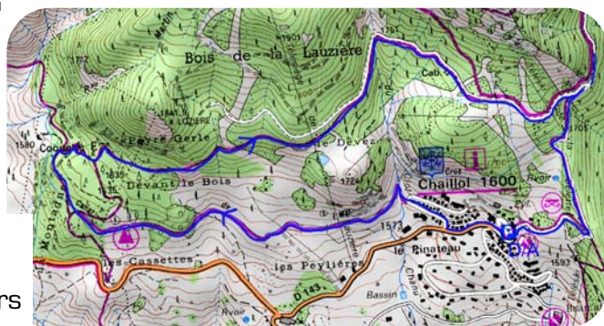
Carte IGN 3437 OT Extrait carte IGN SCAN 25 ® - © IGN 2018 Copie et reproduction Interdite