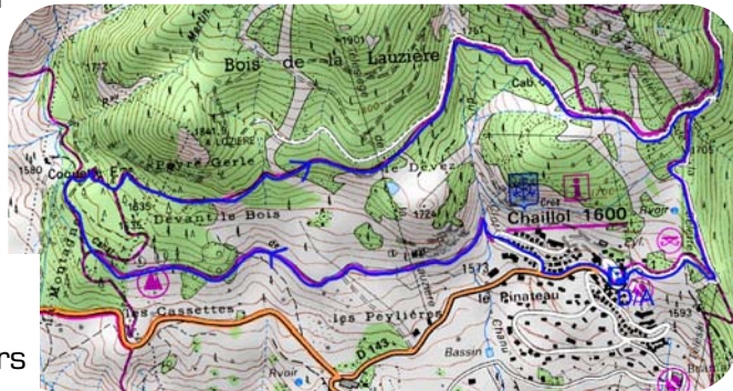
Carte IGN 3437 OT Extrait carte IGN SCAN 25 ® - © IGN 2018 Copie et reproduction Interdite