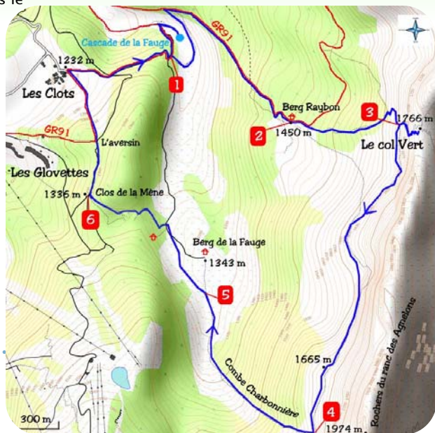
Carte IGN 3235 OT

Prendre à gauche le sentier en balcon qui longe les falaises des rochers du Ranc des Agnelons. Ignorer le sentier sur votre droite qui ramène directement à la bergerie de Roybon. Atteindre par ce sentier la combe de Charbonnière (4) qu'un sentier permet de dévaler aisément malgré un bel éboulis. Au niveau de la balise les Bonchauds (1365 m), continuer tout droit la descente vers la bergerie de la Fauge. Peu avant celle-ci, obliquer à gauche (5) puis à l'intersection prendre à gauche le sentier. Après une courte montée puis un replat (6), filer à droite vers les Clos à seulement 900 mètres.