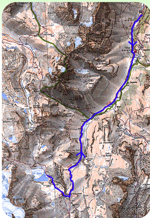
Carte IGN 3431 OT