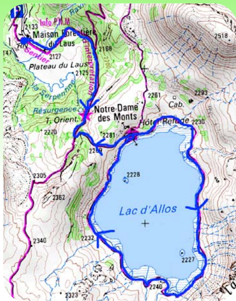
Carte IGN 3540 OT Extrait carte IGN SCAN 25 ® - © IGN 2018 Copie et reproduction Interdite

L'éditeur, l'auteur ou le diffuseur ne sauraient être tenus pour responsable dans l'hypothèse d'un accident sur cet itinéraire, et ce, quelles qu'en soient les causes. Pour les secours composer le 112.