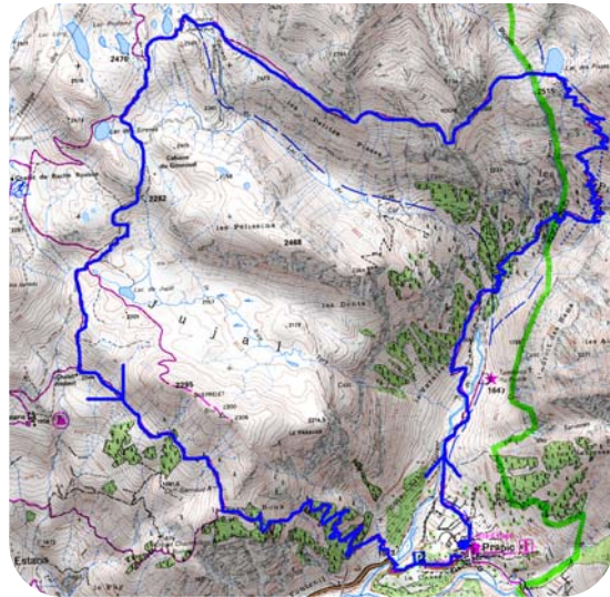
Carte IGN 3437 ET

sentier en balcon et de niveau. Cheminer ainsi jusqu'aux petits lacs non loin des remontées mécaniques de la station d'Orcières-Merlette. Prendre à droite plein sud jusqu'au chalet Joubert (5H). Bifurquer à gauche vers l'est. Enfin au croisement suivant (6H) poursuivre à gauche pour dévaler la forêt jusqu'à Prapic (7H).