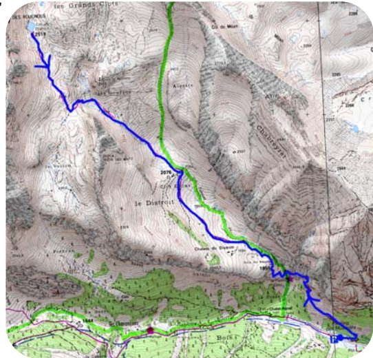
Carte IGN 3437 ET

Continuer sur la piste à droite du parking