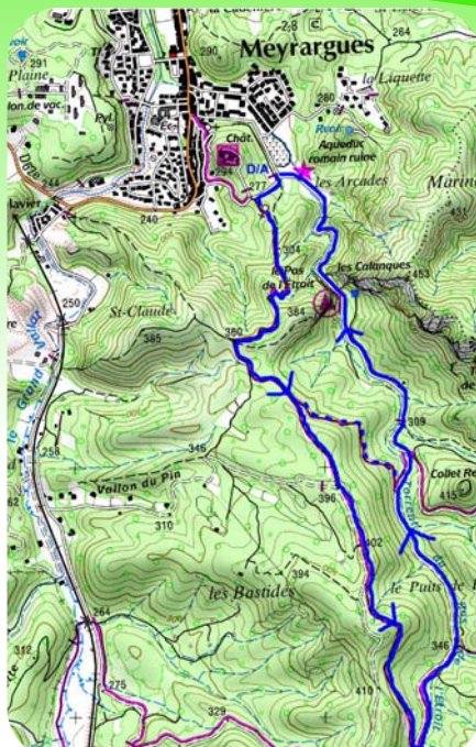
Carte IGN 3244 ET Extrait carte IGN SCAN 25 ® - © IGN 2018 Copie et reproduction Interdite

L'éditeur, l'auteur ou le diffuseur ne sauraient être tenus pour responsable dans l'hypothèse d'un accident sur cet itinéraire, et ce, quelles qu'en soient les causes. Pour les secours composer le 112.