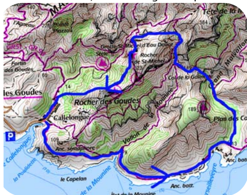
Carte IGN 3445 ET Extrait carte IGN SCAN 25 ® - © IGN 2018 Copie et reproduction Interdite

Enfin, suivre à gauche l'itinéraire vert 1, qui traverse une sorte de cirque et rejoint Callelongue (3h).