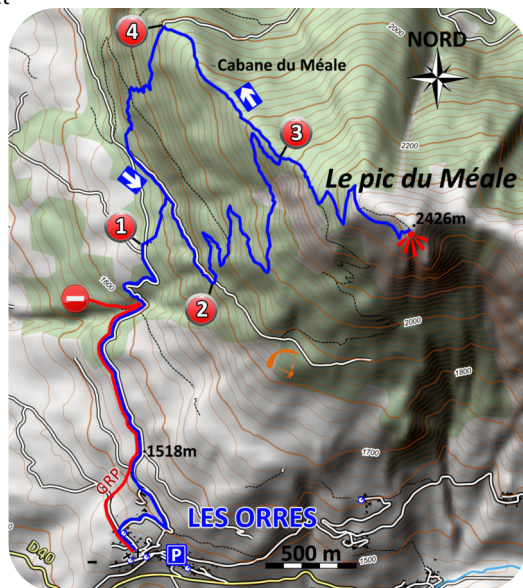
Carte IGN 3438 ET

L'éditeur, l'auteur ou le diffuseur ne sauraient être tenus pour responsable dans l'hypothèse d'un accident sur cet itinéraire, et ce, quelles qu'en soient les causes. Pour les secours composer le 112.