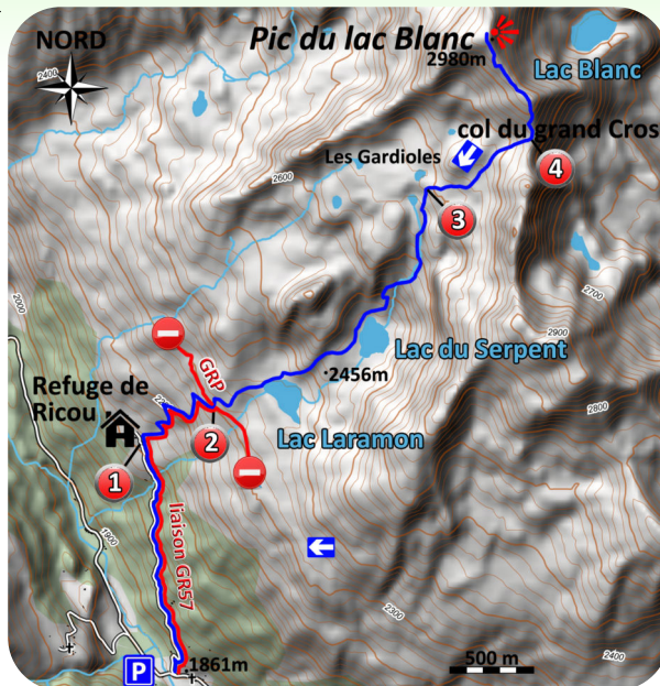
Carte IGN 3535 OT

L'éditeur, l'auteur ou le diffuseur ne sauraient être tenus pour responsable dans l'hypothèse d'un accident sur cet itinéraire, et ce, quelles qu'en soient les causes. Pour les secours composer le 112.