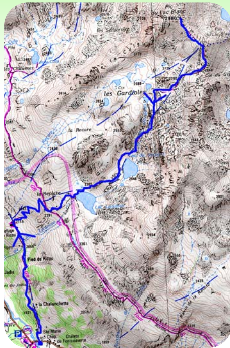
Carte IGN 3535 OT Extrait carte IGN SCAN 25® - © IGN 2018 Copie et reproduction Interdite

Pour le retour reprendre l'itinéraire en sens inverse (7H).