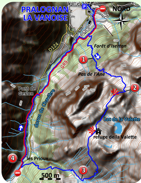
Carte IGN 3534 OT