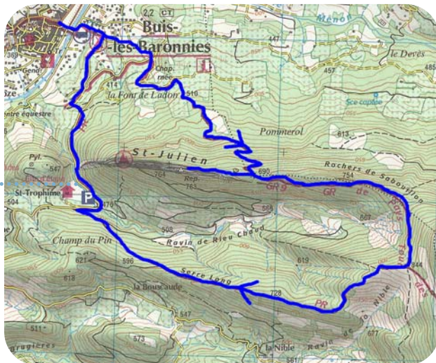
Carte IGN 3140 ET - © IGN 2018

Plus bas, juste après un gros cairn , l'itinéraire rejoint un autre sentier que l'on emprunte vers la droite. Par la suite, suivre la piste forestière vers la droite jusqu'à rejoindre la route. Suivre celle-ci par la droite jusqu'à un banc sous un tilleul. Le sentier dévale sur la gauche jusqu'à rejoindre à nouveau la route. Celle-ci ramène jusqu'à Buis les Baronniees en moins de 10'.