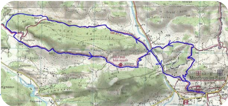
Carte IGN 3240 OT - © IGN 2018 Extrait carte IGN SCAN 25 ® Copie et reproduction Interdite

Plus loin, l'itinéraire s'oriente franchement vers le sud et on rejoint une large piste. Quitter ici les marques rouges et blanches du GR pour filer à gauche vers l'est. Un petit crochet bien balisé (marques jaunes) est nécessaire pour contourner la ferme Truphémus. Au-delà, nous retrouvons une large piste simple à suivre. Au col de Vic, entamer la descente par la route goudronnée jusqu'au pont de Vénéjean déjà franchi. Prendre à droite sur la D159, puis tourner sur la deuxième route à gauche après 400 mètres. Remonter jusqu'à la porte Sainte Marie et flâner dans les calades étroites du vieux village.