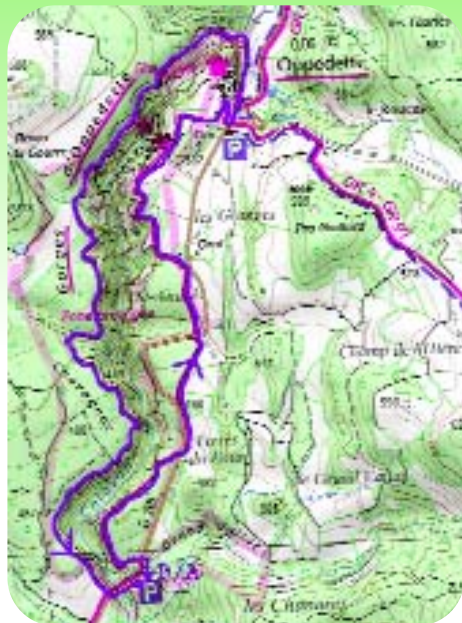
Carte IGN 3242 OT Extrait carte IGN SCAN 25 ® - © IGN 2018 Copie et reproduction Interdite

L'éditeur, l'auteur ou le diffuseur ne sauraient être tenus pour responsable dans l'hypothèse d'un accident sur cet itinéraire, et ce, quelles qu'en soient les causes. Pour les secours composer le 112.