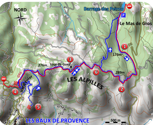
Carte IGN 3043 OT

(5). La piste rejoint le GR6 au niveau de la citerne. Suivre le GR6 dans le sens inverse que précédemment. Passer à nouveau non loin de la tour, puis plus loin dans la descente (6), tourner à gauche au niveau d'une anfractuosit  dans la roche (borne AL112). En suivant cette piste principale vous retrouvez votre v hicule (4H).