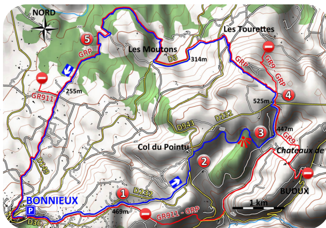
Carte IGN 3242 OT

traverserez le paisible hameau des Tourettes ainsi que le bucolique ravin de Segrié (5). Les vergers et les vignes vous accompagneront sur des chemins ancestraux jusqu'au village de Bonnieux.