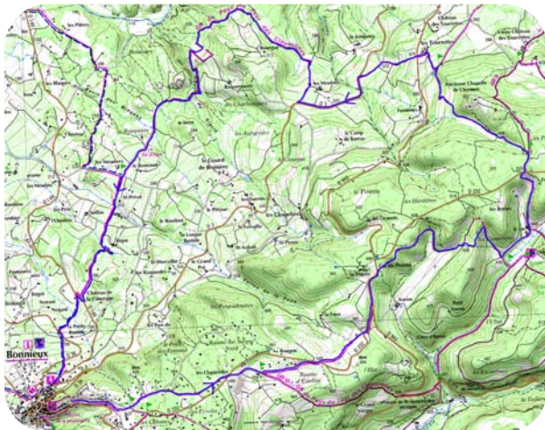
Carte IGN 3242 OT Extrait carte IGN SCAN 25 ® - © IGN 2012

Suivre à nouveau les marques du GRP jusqu'à Bonnieux. Avant cela, vous traverserez le paisible hameau des Tourettes ainsi que le bucolique ravin de Segrié. Les vergers et les vignes vous accompagneront sur des chemins ancestraux jusqu'au village de Bonnieux.