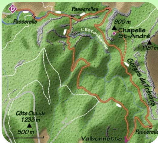
Carte IGN 3441 OT

Variante : A l'intersection remonter à droite vers la chapelle Saint André. Au replat, tourner à gauche pour terminer l'ascension du piton rocheux où se niche la chapelle. Compter une heure supplémentaire et 100 mètres de plus de dénivellée positive.