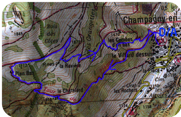
Carte IGN 3532 OT - © IGN 2018

Laissez votre véhicule sur la parking face à la mairie