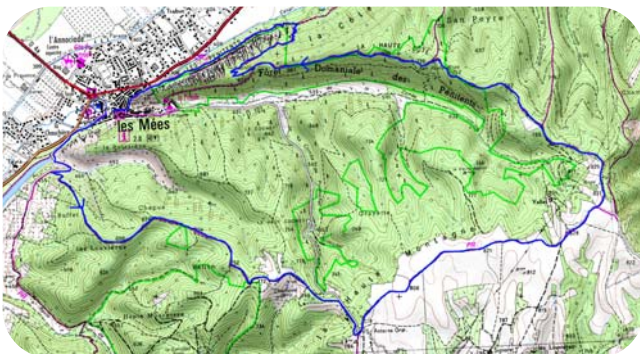
Carte IGN - 3341 OT Extrait carte IGN SCAN 25® - © IGN 2018 Copie et reproduction Interdite

A l'oratoire , plusieurs pistes s'offrent à vous. Prendre celle la plus à gauche (nord) en direction de la "Haute Montagne". Peu après la ligne EDF continuer sur la piste à gauche, puis sur celle de droite après 100 mètres. Continuer encore 300 mètres avant de prendre la deuxième piste à gauche en direction des "Mées". Peu avant le pylône bien visible tourner à gauche. A l'intersection avec le PR de Malijaï, continuer en face en longeant le champ par la droite.