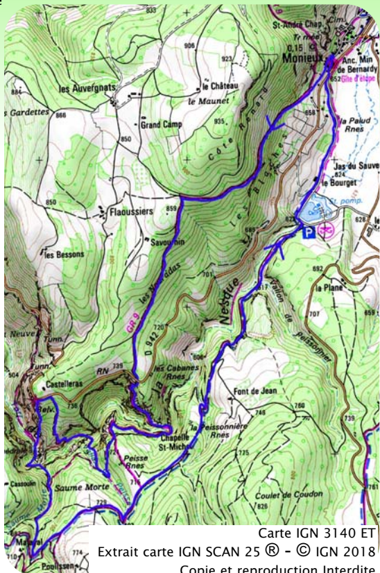
Carte IGN 3140 ET Extrait carte IGN SCAN 25 ® - © IGN 2018 Copie et reproduction Interdite

RISQUE INCENDIE : Les accès aux massifs de la Vaucluse sont soumis à réglementation en période estivale.