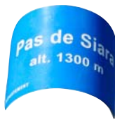
Carte IGN 3138 OT - © IGN 2018