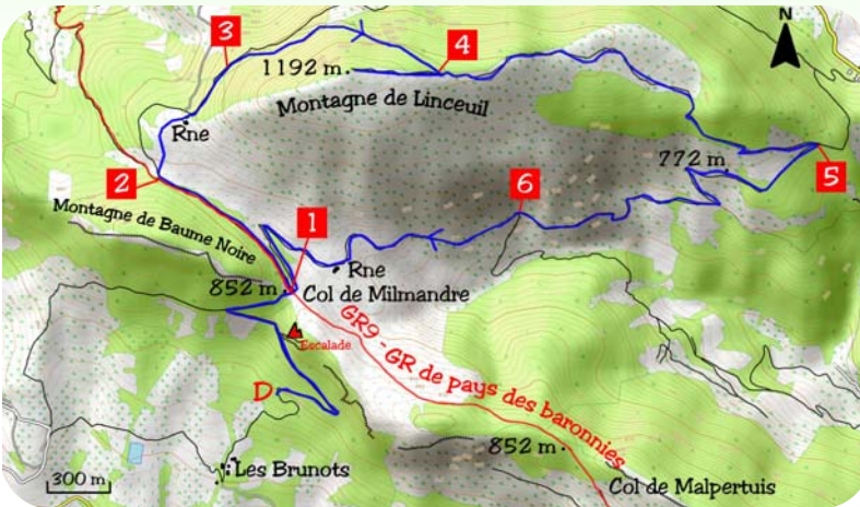
Carte IGN 3139 OT

large chemin. Plus bas, celui-ci oblique au sud et bascule sur l'adret. Il rejoint une nouvelle piste (5) que l'on suivra vers la droite. Dans le premier creux, ignorer la piste venant de gauche pour poursuivre en face (flèche bleue). Idem dans le deuxième creux (6). Rejoindre une vieille ruine, puis à nouveau, le col de Milmandre. Emprunter la même piste que précédemment pour rejoindre le parking du départ.