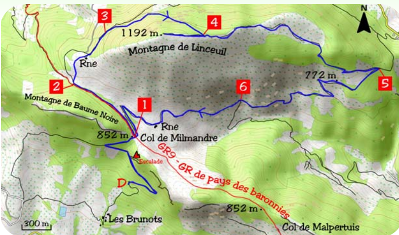
Carte IGN 3139 OT

large chemin. Plus bas, celui-ci oblique au sud et bascule sur l'adret. Il rejoint une nouvelle piste (5) que l'on suivra vers la droite. Dans le premier creux, ignorer la piste venant de gauche pour poursuivre en face (flèche bleue). Idem dans le deuxième creux (6). Rejoindre une vieille ruine, puis à nouveau, le col de Milmandre. Emprunter la même piste que précédemment pour rejoindre le parking du départ.