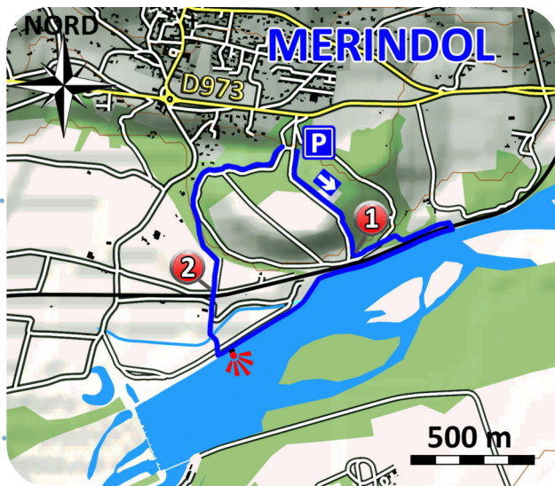
Carte IGN 3143 OT

L'itinéraire débute à l'aire de pique-nique à droite à la sortie du village en direction de Pertuis.