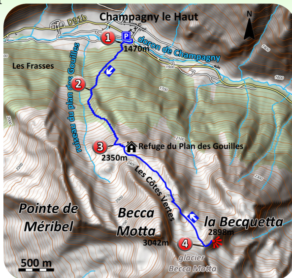
Carte IGN 3534 OT

Pour le retour prendre le même itinéraire en sens inverse.