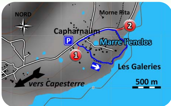
Carte IGN 4604 GT

D ébuter la randonnée en prenant le large chemin qui descend légèrement dans les pelouses. Après seulement 100 mètres (1), obliquer légèrement sur la gauche et continuer la descente dans le talweg. Après 150 mètres, poursuivre la descente vers la gauche sur un petit chemin sous le couvert végétal. Il mène en quelques minutes au bord de l'océan Atlantique au lieu-dit des Galeries. Profiter de cet endroit avant de poursuivre. Le sentier, un peu moins évident à voir, débute en direction du nord-est à une dizaine de mètres du rivage. Ce sentier escarpé par endroit, n'est pas dangereux, même s'il est nécessaire à quelques reprises de s'aider des mains. Après 10 minutes, on retrouve, presque à regret, une route goudronnée qui remonte (2). En suivant celle-ci par la gauche, vous rejoindrez le départ de la randonnée.