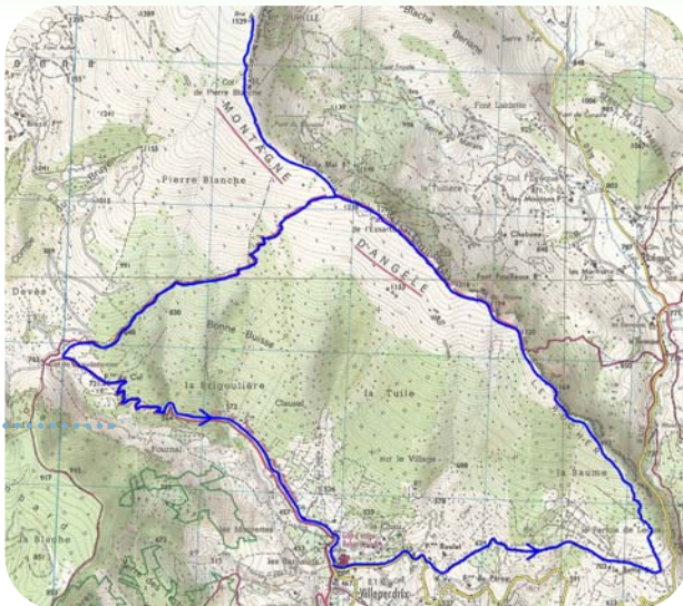
Carte IGN 3139 OT - © IGN 2018

Continuer la progression sur crête jusqu'au pas de l'Essartier. A cet endroit, continuer l'ascension sur le GRP (marque rouge et jaune). Plus haut des piquets indiquent l'itinéraire de retour. Mais pour atteindre le sommet de la montagne d'Angèle rester sur la crête. Il n'y a ni marque ni sentier mais l'itinéraire est évident par temps clair pour rejoindre le rocher de l'Esqueyron à 1602 mètres (hors carte). De retour au niveau des piquets, suivre ces derniers jusqu'au col de Chaudebonne. Là, prendre la piste à gauche puis la route jusqu'à Villeperdrix.