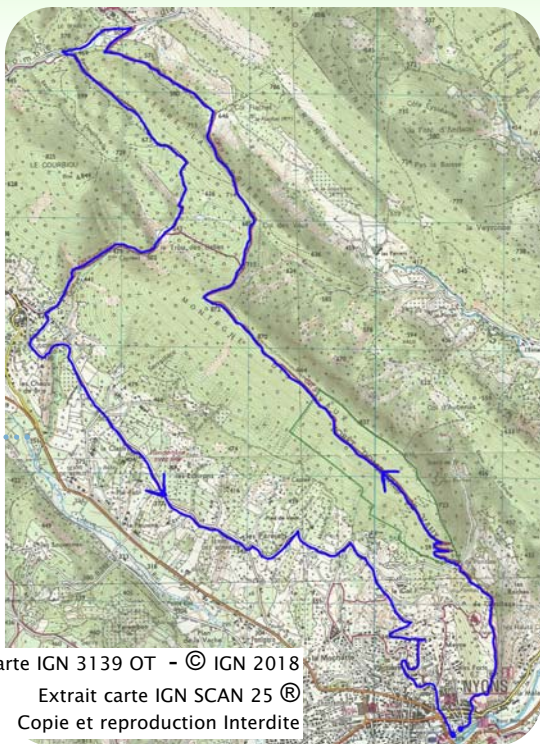
Carte IGN 3139 OT

Au pied des crêtes , emprunter la piste sur quelques mètres seulement avant de bifurquer à gauche au niveau d'une dalle de calcaire. Traverser un torrent pour rejoindre une route au niveau de la combe de Sauve où l'on abandonne le GR9. L'emprunter sur 500 mètres par la gauche avant de retraverser le torrent par une large piste. De l'autre côté, suivre le sentier sur la gauche (marque jaune). Celui-ci remonte le vallon de la Sigalette. Au niveau de la balise Trappe du Loup, filer tout droit en direction du Réservoir. A cette nouvelle balise prendre la route à gauche. Au niveau du lieu-dit les Paréjats poursuivre sur la route de gauche. Il ne reste que deux kilomètres pour rejoindre Nyons.