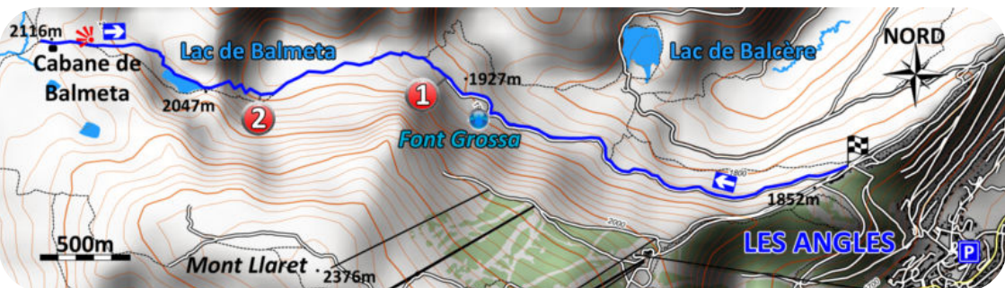
Carte IGN - 2249 ET

(1) le long du torrent où il est parfois nécessaire de faire sa trace. Des marques jaunes indiquent l'itinéraire à suivre. Remonter entre les pins à crochets en prenant assez rapidement rive droite. Poursuivre ainsi jusqu'au fond du vallon dont la sortie est défendue par un ressaut rocheux. Prendre à gauche de celui-ci (2). Le couloir à emprunter, parfois avalancheux, débouche sur le déversoir du lac de la Balmeta. Préférer longer celui-ci par la droite plutôt que de le traverser sur une hypothétique épaisseur de glace. Continuer vers l'ouest en louvoyant entre les pins. Des replats se succèdent après de courtes montées. Alors que le paysage s'ouvre, le grand et le petit Péric se laissent enfin admirer. La cabane de la Balmeta (2120 mètres) ouverte mais pas très propre (hiver 2015) est toute proche. Du haut de ses 2921 mètres, le seigneur local, le Carlit trône au loin dans le somptueux panorama. Retour par le même itinéraire.