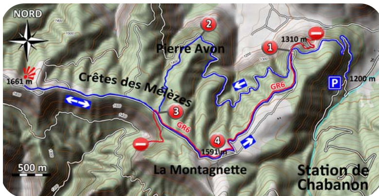
Carte IGN 3439 ET

L'itinéraire débute par le chemin forestier vers la droite