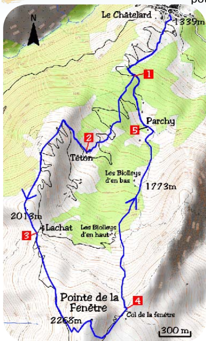
Carte IGN 3433 ET

L'éditeur, l'auteur ou le diffuseur ne sauraient être tenus pour responsable dans l'hypothèse d'un accident sur cet itinéraire, et ce, quelles qu'en soient les causes. Pour les secours composer le 112.