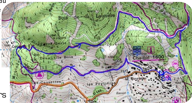
Carte IGN 3437 OT

Entamer une courte montée dans la forêt en direction de Peyre Gerle par le sentier à droite. L'été, la fraîcheur du sous bois est la bienvenue. Couper une piste et terminer l'ascension en suivant le Clos Chenu. Le paysage s'ouvre à nouveau et laisse place à quelques pistes de ski. Le Clos Chenu marque le point le plus haut de cet itinéraire (1760m). Continuer sur la large piste vers l'est, celle-ci ramène jusqu'au pied du télésiège et du parking par une descente assez douce. Et si vous entendez des cris stridents provenant du ciel, c'est que l'aigle rode !