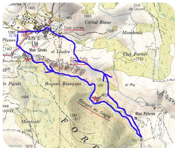
Carte IGN 2250 ET

on atteint le col de la chapelle San Feliu. La vue depuis la chapelle mérite ce petit détour. Pour le retour revenir au col et entamer la descente vers la gauche. Après quelques lacets de descente caillouteuse on aperçoit la tour de guet de Llo. Après le Rec del Pastoret on entre dans le village. Traverser ses fraîches ruelles jusqu'au bas du village où l'on retrouve le parking.