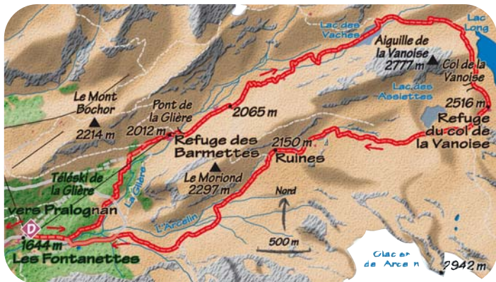
Carte IGN 3534 OT

De belles pierres plates permettent de le traverser en son centre. Continuer la descente jusqu'au refuge des Barmettes. Peu après, prendre le second chemin à gauche qui redescend à travers la forêt. Ce dernier vous amène jusqu'au parking des Fontanettes.