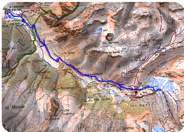
Carte IGN 3532 ET & 3633 ET & 3534 OT - © IGN 2013

Laissez votre véhicule au parking du Laisonnay d'en Bas