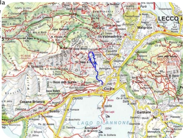
Carte Lago di Como - 1/50 000

Depuis le terminus du bus (ligne C40) contourner l'usine par la gauche