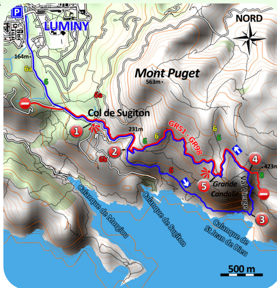
Carte IGN 3145 ET Carte IGN Les calanques au 1/15 000