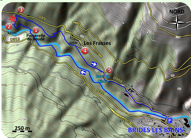
Carte IGN 3532 OT

L'itinéraire débute à 20 mètres de l'entrée du parking, au pont Simond. Prendre à gauche un petit chemin qui longe une maison. Celui-ci rejoint rapidement les berges en rive gauche du doron de Bozel. Toute la première partie longe l'impétueux torrent. Quelques panneaux donnent régulièrement la distance depuis Brides-les-Bains. Il s'agit d'un sentier agréable de part la fraîcheur de la frondaïson et des eaux glaciaires du doron. Il en sera ainsi jusqu'à la passerelle de Baudée (1) que l'on franchira. Le sentier prend désormais de l'altitude et rejoint la fin d'une petite route (2). Continuer à grimper en prenant en face le long d'une vigne pionnière. Peu après, prendre le chemin vers la droite en direction de Brides-les-Bains (3). Cette intersection marque la fin de la montée. On évolue dans un espace plus ouvert et l'on peut apercevoir la pointe du Petit Niélard. Au niveau d'une intersection sous le hameau des Frasses, prendre le large chemin de droite qui redescend légèrement (4). Après une courte montée, vous rejoignez la route au niveau du Saut du Lièvre (5). Suivre celle-ci vers la droite jusqu'à rejoindre le pont de Simond à un kilomètre.